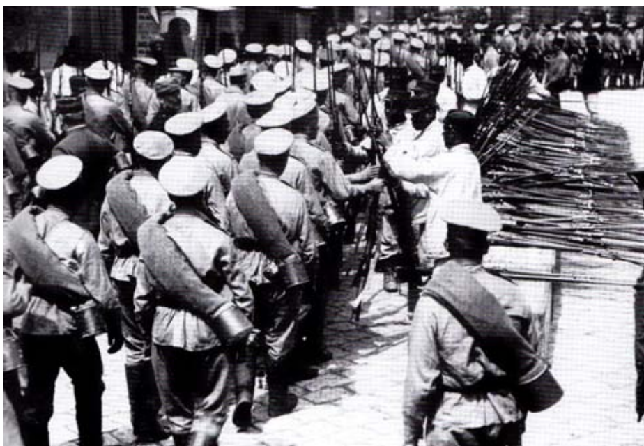
Ci-contre : Marseille. À la descente des navires, les soldats russes reçoivent le nouveau fusil Berthier mod. 1907.15