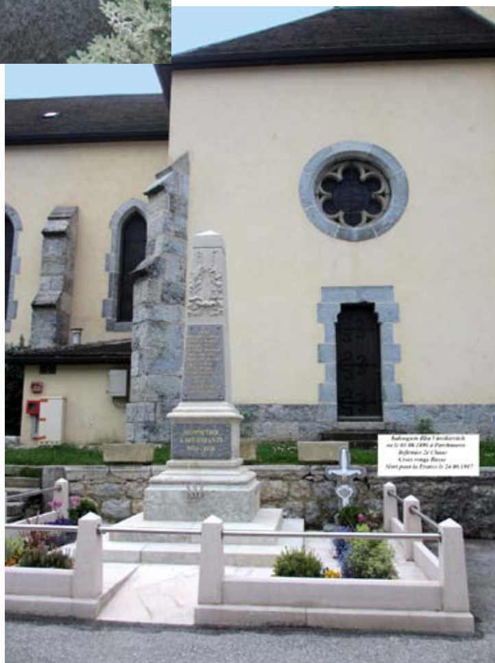
Ci-contre, «croix-épée» près du monument aux morts de Monnetier.