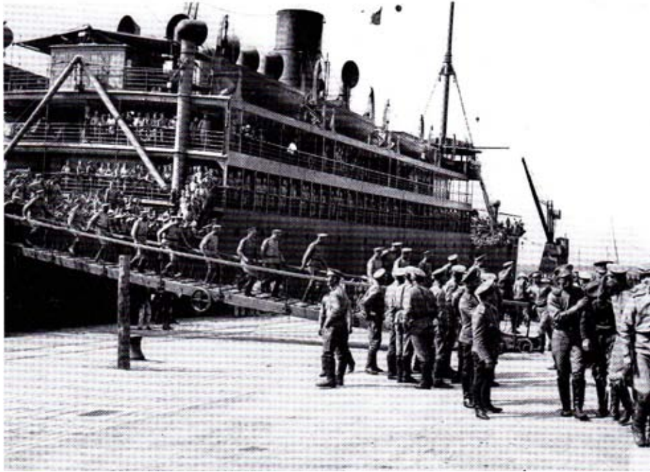
Brest, 17 juillet 1916. Navire de transport de troupes Vénézuéla. Débarquement des soldats du 3 e régiment d'infanterie, appartenant à la 2 e brigade spéciale en provenance d'Arkhangelsk.