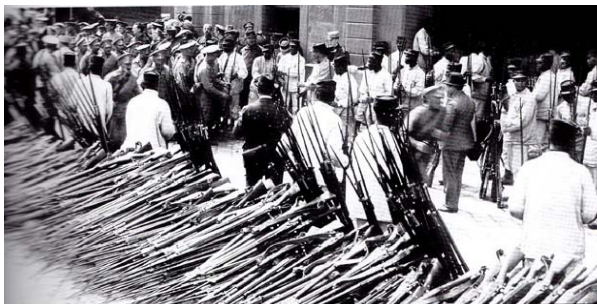
Marseille. Les soldats coloniaux distribuent le fusil d'infanterie Berthier mod. 1907.15

Les illustrations de cette pages sont extraites de l'ouvrage de Gérard Gorokhoff et Andreï Korliakov Le corps expéditionnaire russe en France et à Salonique 1916/1918.