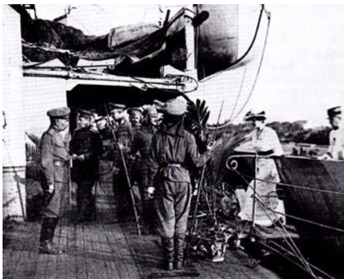
Ci-contre : Escale à Saïgon du Latouche-Tréville. Les deux sentinelles russes sont armées du vieux fusil Berdan mod. 1870.