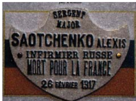
Une des plaques nominatives originelles, prélevées pour être mises à l'honneur dans les mairies d'accueil. L'orthographe peut sensiblement changer en fonction du passage des caractères cyrilliques aux caractères romains.