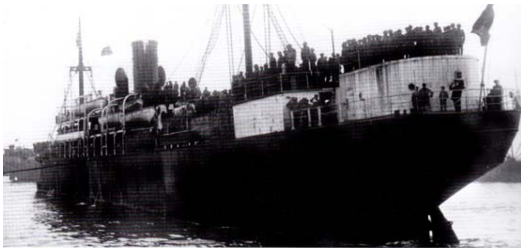
Marseille, 20 avril 1916. Le paquebot Latouche-Tréville s'amarre pour débarquer les soldats de la 1 ère brigade spéciale.